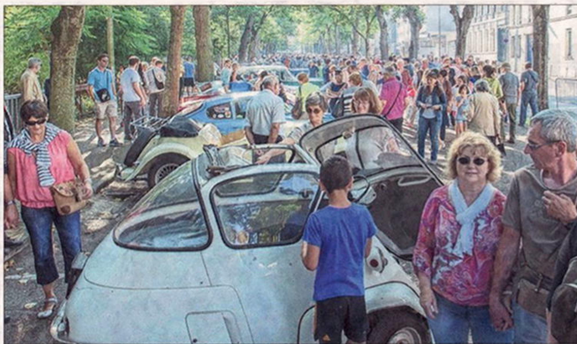
Des milliers de visiteurs aux « 48 Heures d'automobiles anciennes », l'une des initiatives du Kiwanis.

Membre du Kiwanis club de Troyes, il est aussi lieutenant-gouverneur pour la Champagne-Ardenne. Une région qui compte neuf clubs, dont quatre dans l'Aube : le Kiwanis club de Troyes, le club Chrestien de Troyes, le club Troyes Féminin Plurielles et le club Arcis